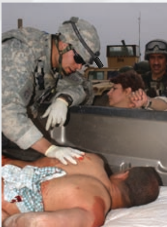
Multiples Operaciones Medicas locales con cámara de color y auricular montados en el casco