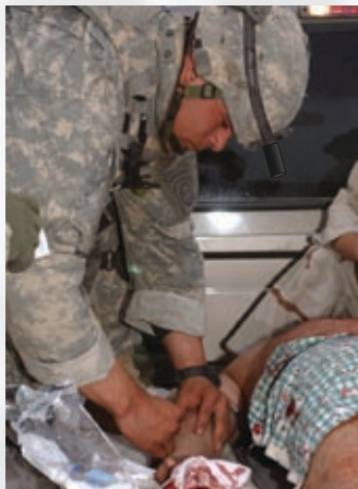
Multiples Operaciones Medicas locales con cámara de color y auricular montados en el casco